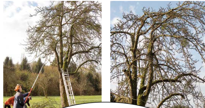
Sanierung eines stark mit Misteln befallenen Apfelbaumes

Heute wissen wir es besser: Die immergrüne Mistel ist ein Halbschmarotzer, der durch die erbsengroßen, weißen Beeren in denen die Samen eingebettet sind, verbreitet wird. In der biologischen Systematik haben wir es meist mit der weißbeerigen Laubholzmistel, lateinisch „ Viscum album subspecies album “, zu tun.