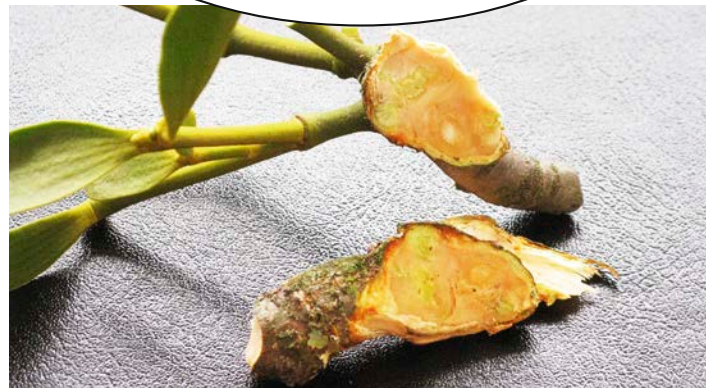
Beginnendes Wachstum der Haustorien einer noch jungen Mistel

MISTELN ENTZIEHEN DEM WIRTSBAUM VIEL WASSER UND WERTVOLLE NÄHRSTOFFE